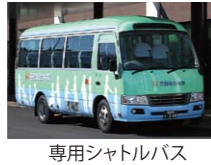
専用シャトルバス