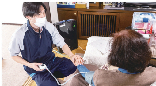
▲体調管理（血圧、体温、血中酸素濃度など）